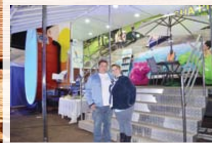
iGui Piscinas - Leme