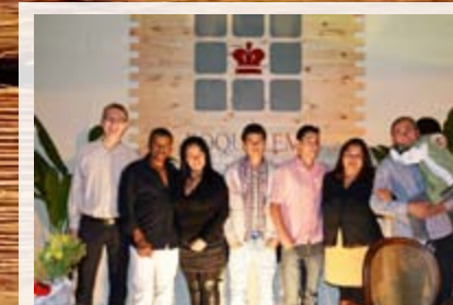
Roque Leme Móveis