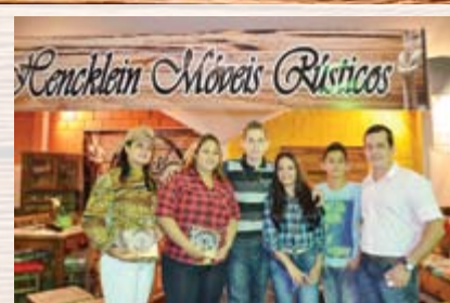
Hencklein Móveis Rústicos