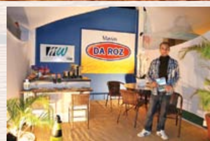
Massas Da Roz