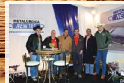
Metalúrgica New Tec