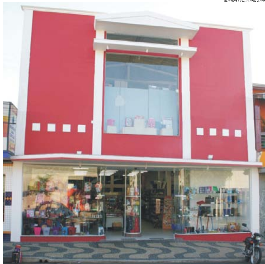
Araújo / Papelaria André

"O ramo de papelaria vem se modernizando muito rápido, portanto,