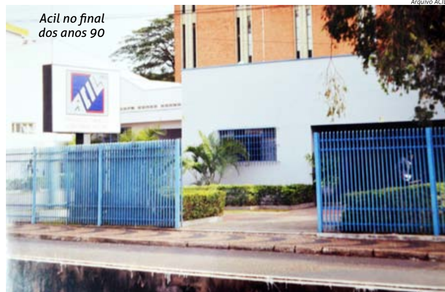
Acil no final dos anos 90