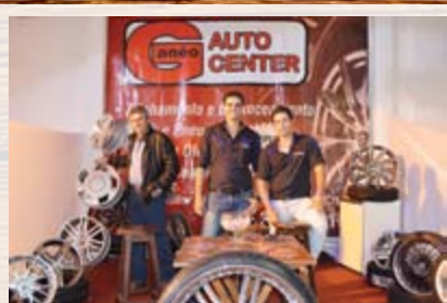
Ganéó Auto Center