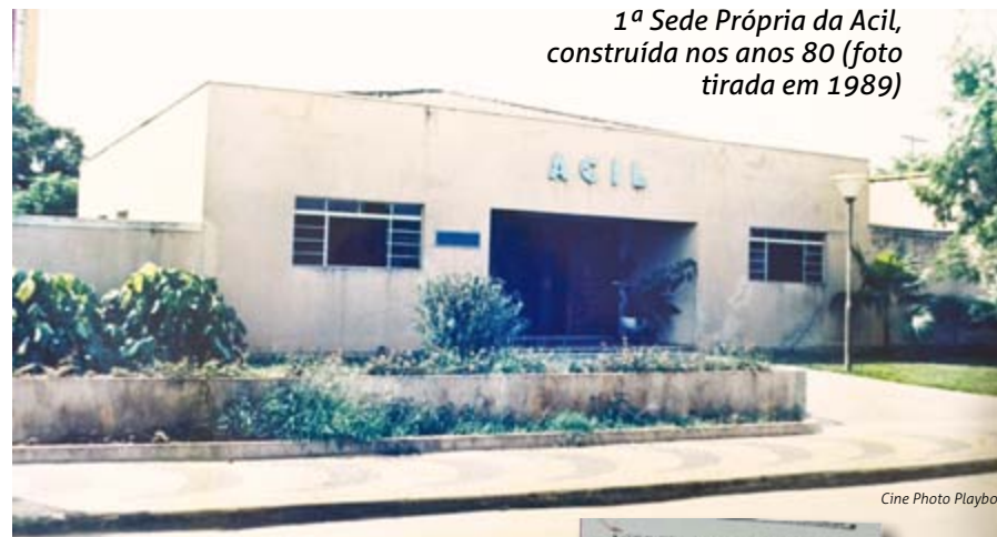
1ª Sede Própria da Acil, construída nos anos 80 (foto tirada em 1989)

A primeira Diretoria empossada foi composta pelos seguintes Empresá-