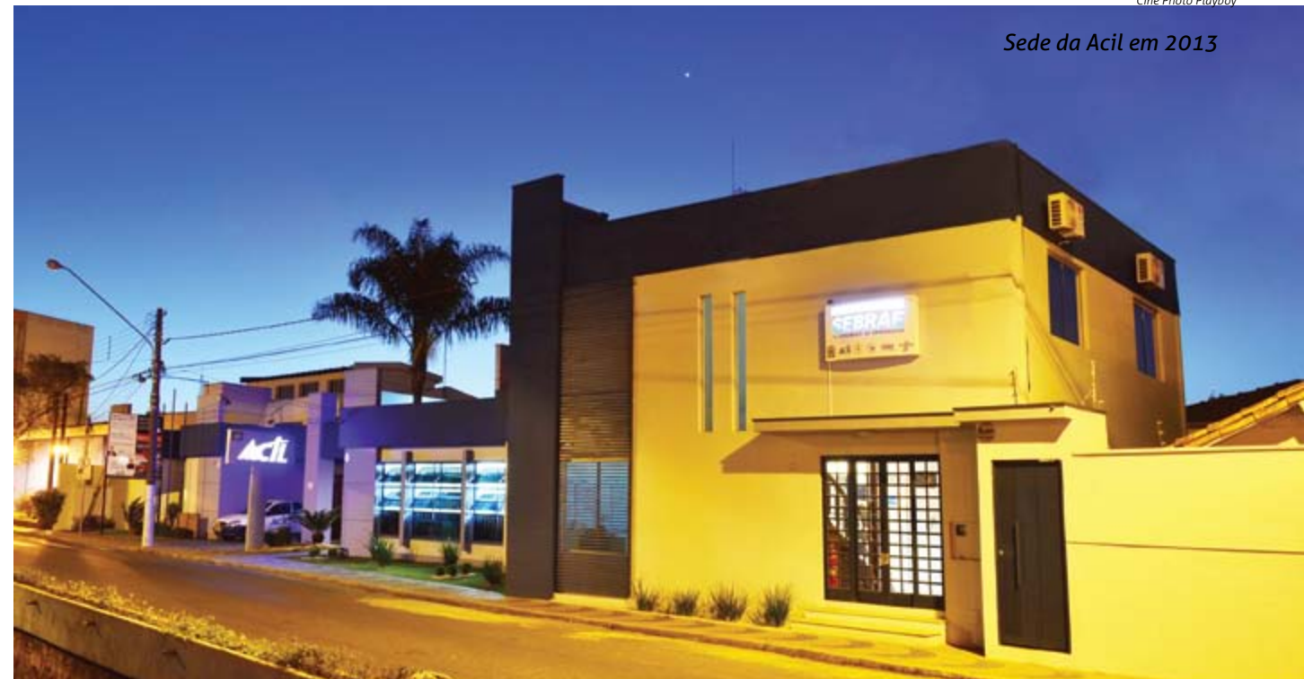
Sede da Acil em 2013