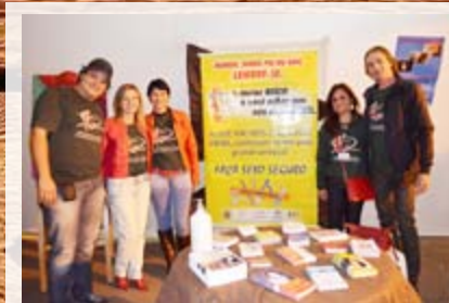
Secretaria da Saúde