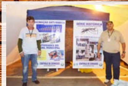
Núcleo de Controle de Zoonoses