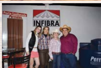
Infibra - Permatex