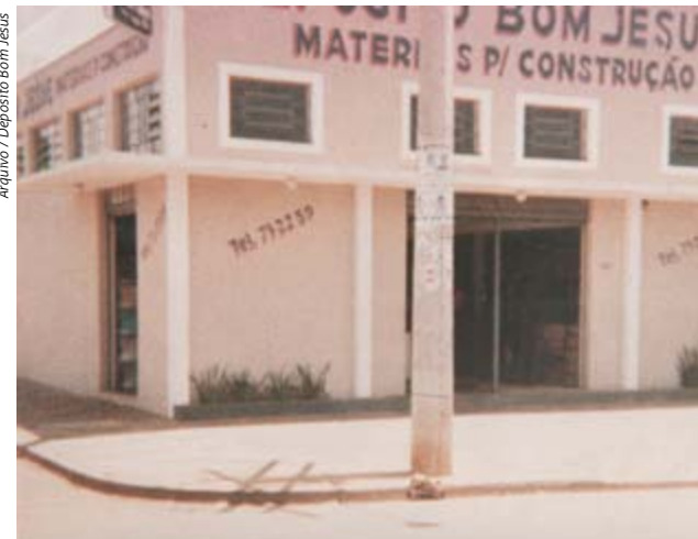
Arquivo / Depósito Bom Jesus

Filial: Av. Visconde de Nova Granada, 1313 - Itamaraty - Leme/SP Fone: (19) 3573.6968